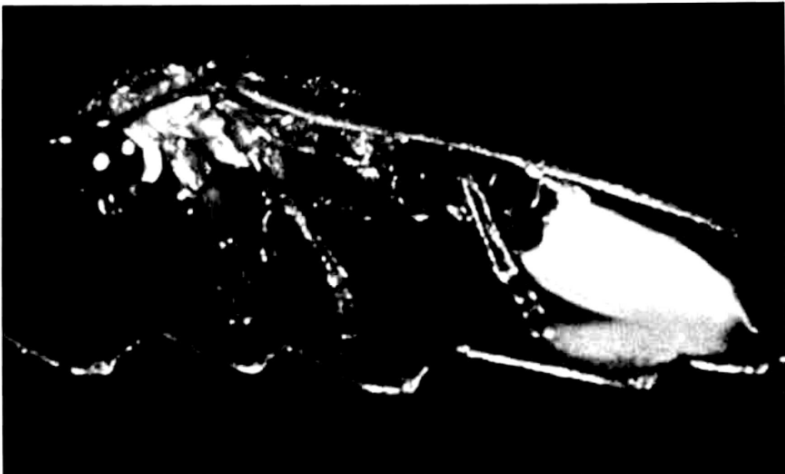
Abb. 1: Selbstleuchtender Käfer aus der Familie der Lampyridae. Der gezähnte Rand des Blattes reflektiert das von dem Käfer ausgesandte Licht.

Das Selbstleuchten (Biolumineszenz), die Fähigkeit der Lebewesen, mittels eigener physiologisch-chemischer Reaktionen zu leuchten, tritt in etwa der Hälfte aller Tierstämme von den niederen Tieren bis einschließlich der Fische auf. Im Pflanzenreich hingegen sind es nur wenige Bakterien, Algen und Pilze, die biologisch leuchten können. Beim Hallimasch ( Armillaria mellea ) – der in unseren Wäldern als essbarer, wohlschmeckender Pilz häufig vorkommt – leuchten die